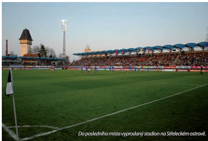
Do posledního místa vyprodaný stadion na Střeleckém ostrově.

Podobně hovořil i kapitán českého národního týmu Tomáš Rosický , který podobně jako Tomáš Sivok obdivoval především prostředí na Střeleckém ostrově: „Prostředí v Českých Budějovicích jsem vůbec nepoznal. Naposledy jsem tady byl před více než deseti lety se Spartou a ten stadion je nyní úplně jiný. Je tady příjemné fotbalové prostředí, neměli jsme s ničím žádný problém a určitě jsem se sem rád podíval,“ řekl hráč Arsenalu Londýn.